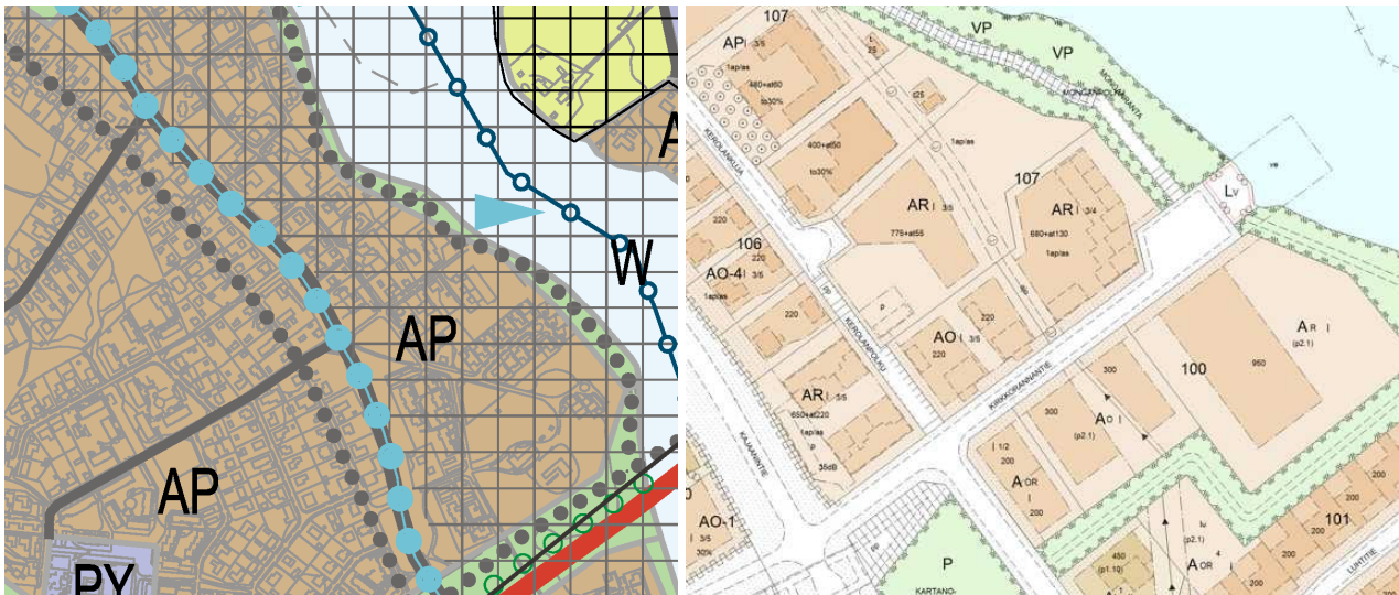
Kuvat: Ote Uuden Oulun yleiskaavasta sekä ote ajantasa-asemaakavayhdelmästä. (Ei mittakaavassa.)

Korttelialueen kohdalla on voimassa ympäristöministeriön 21.2.1990 vahvistama asemakaava (564-1319), jossa molemmat tontit on osoitettu rivitalojen ja muiden kytkettyjen rakennusten korttelialueeksi. Tonteille liitytään Kirkkorannantien ja Kerolankujan kautta.