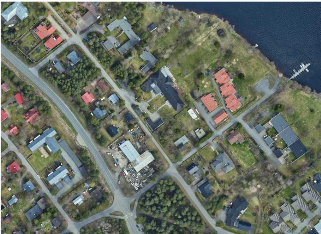
Kuva: Ilmakuva alueesta vuonna 2017.

Tonttien välissä on jalankulkijoiden ja pyöräilijöiden käytössä oleva Kerolanpolku. Kaava-aluetta sivuavat myös Kajaanintie, Kirkkorannantie ja Kerolankuja.