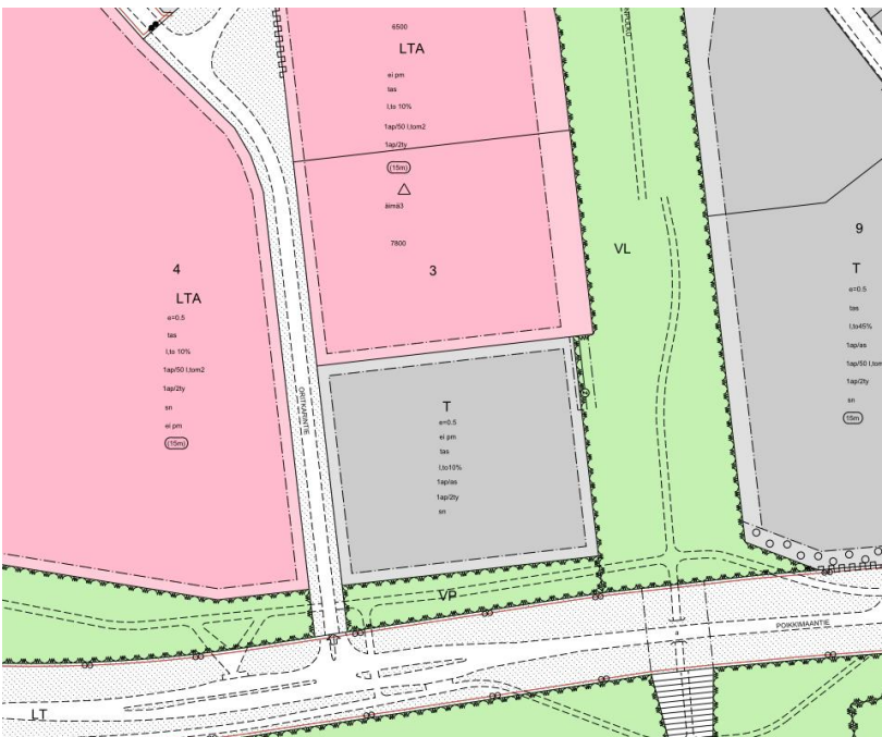
Kuva 4. Karttaote voimassa olevasta asemakaavasta.

Alueella on voimassa asemakaava (564-1738), joka on tullut voimaan 17.6.2002. Tontin käyttötarkoitus on teollisuus- ja varastorakennusten korttelialue (T). Rakennusoikeus on esitetty tehokkuusluvulla 0,5, eli kerrosalan suhde tontin pinta-alaan nähden. Korttelialueelle ei saa sijoittaa päivittäistavaramyymälää. Rakennusalalle sallitusta kerrosalasta saa 10 % käyttää liike- ja toimistotiloja varten. Tontille on rakennettava yksi autopaikka kahta tontilla samanaikaisesti työskentelevää henkilöä kohti. Lentokentän puisto on osoitettu lähivirkistysalueeksi (VL).