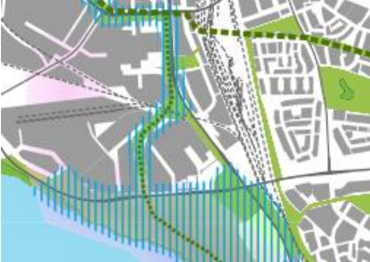
Kuva 3. Karttaote VILMO:n luonnon ja maiseman suositukset maankäytölle.

Uuden Oulun yleiskaavaan liittyvässä Oulun viheralueverkosto ja luonnon monimuotoisuus -erillissuunnitelmassa (VILMO) suunnittelualueen itäpuolella Lentokentänpuisto on merkitty tärkeäksi viheralueverkoston osaksi. Puiston läpi on merkitty pääviherkäytävä.