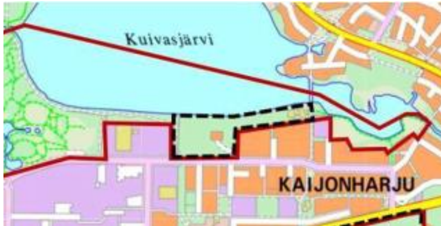
Kuva 7. Tapionrannan asemakaava-alue (mustalla katkoviiva).

Asemakaava-alue koostuu rakennettuun ympäristöön rajautuvasta metsäalueesta ranta-alueineen. Asemakaava-alueen metsät vaihtelevat mänty- ja havupuuvaltaisista metsistä lehtipuuvaltaisiin metsiin. Alueella on osin luonnontilaisen kaltaista tuoretta kangasta, jossa on merkittävästi myös lahoppua. Paikoin alue poikkeaa normaalista kaupunkimetsistä juuri lahoppuun määrän ja latvuskerroksen rakenteen vuoksi. Alue on tulkittavissa luonnontilaisen kaltaiseksi. Linnustossa elinympäristön tila heijastuu mm. lahoppuun kytköksissä olevan töyhtötiaisen esiintymisenä. Pääasiassa lintulajisto on kuitenkin alueen kaupunkimetsille tyypillistä (taulukko 8). Asemakaava-alueen metsät eivät muodosta laajempaa elinympäristökokonaisuutta ja niiden merkitys linnustolle on paikallinen. Asemakaava-alueen ranta-alueilla on rantakasvillisuutta niukasti, eikä niiden osalta todettu erityisiä linnustollisia arvoja.