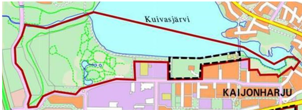
Kuva 6. Kuivasjärven selvitysalue (punainen viiva).

Kuivasjärven alueella on monipuolisia elinympäristöjä vaihdellen yksipuolisemmista, pienistä kaupunkimetsiköistä kasvitieteellisen puutarhan ja Kuivasjärven ranta-alueisiin. Kasvitieteellisen puutarhan länsi- ja luoteispuolella on kosteapohjaista, vanhaa ojikkoa (alun perin rämeitä ja luhtamaisia alueita). Kaavarunkoalueen rannat ovat vahvasti virkistyskäytössä. Ranta-alueilla ja järven itäpään Kaijonlahdella esiintyy jonkin verran ruovikkoa ja ilmaversoista vesikasvillisuutta, joka tarjoaa suojaisempaa elinympäristöä (mm. vesilinnuille). Kaavarunkoalueen metsäisistä elinympäristöistä Tapionrannan asemakaava-alueen metsiköt ovat säilyneet luonnonpiirteiltään alueen monimuotoisimpina.