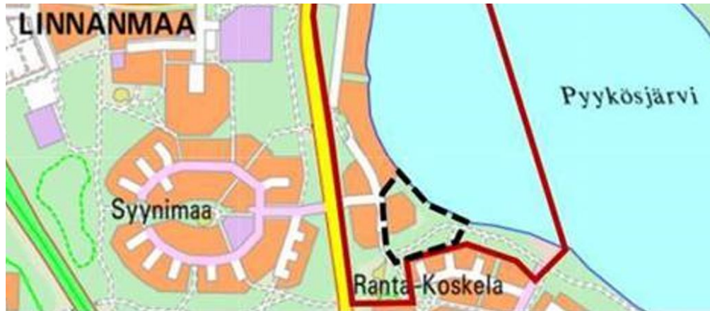
Kuva 3. Ranta-Koskelan asemakaava-alue (musta katkoviiva).

Ranta-Koskelan alue on käytännössä kokonaan ihmisvaikutuksen piirissä ja alueen metsät on valtaosin käsiteltyjä. Rantaosat eivät ole vesi- tai rantalinnuston kannalta erityisen sopivaa pesimisympäristöä. Alueelta havaittiin vain tavanomaisia pihojen, kulttuuriympäristöjen ja kaupunkimetsien lajeja, eikä asemakaava-alueella ei ole erityisiä linnustollisia arvoja.