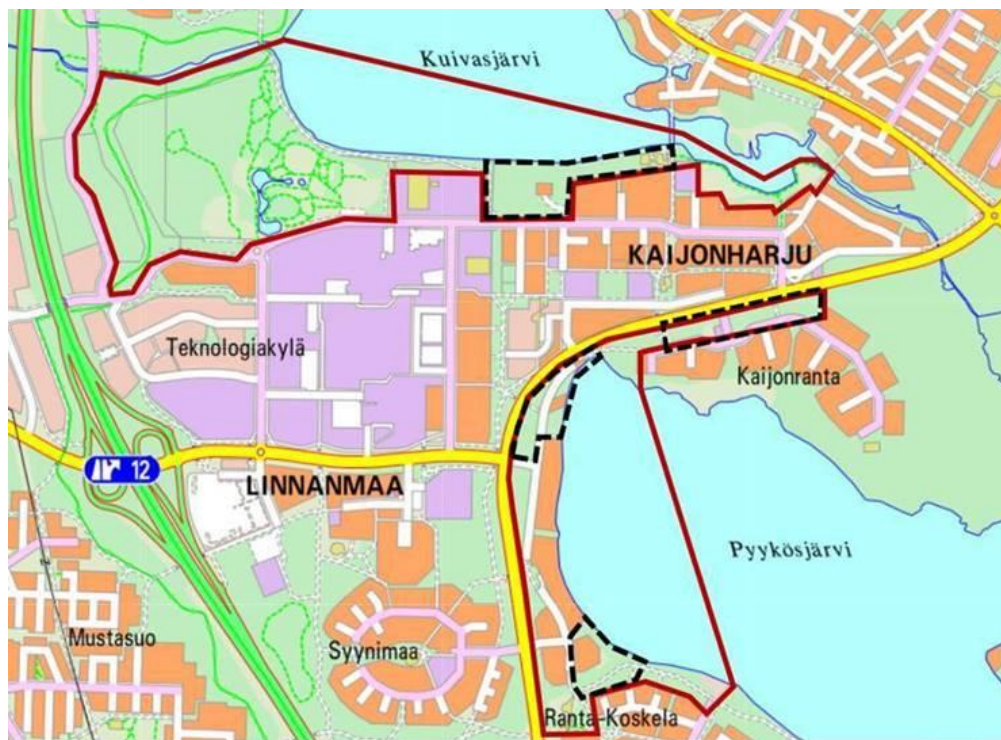
Kuva 1. Linnustoselvityksen selvitysalueina olivat pohjoisempi Kuivasjärven alue ja eteläisempi Pyykösjärven alue (yhtenäiset punaiset rajaukset). Lepakkoselvitys tehtiin ainoastaan Kuivasjärven rannalla sijaitsevalla Tapionrannan asemakaava-alueella (kartalla asemakaava-alueet esitetty mustalla katkoviivalla).

Raportissa Pyykösjärven ja Kuivasjärven alueet on käsitelty omina kokonaisuuksinaan. Niiden osalta on esitetty tärkeimmät lajihavainnot ja mahdolliset suositukset tai esitykset siitä, mitkä alueet ovat linnuston kannalta huomionarvoisimpia alueita. Tämän lisäksi kaavarunkoalueiden sisältämien asemakaava-alueiden osalta on esitetty erikseen selvitysten tulokset ja mahdolliset maankäytön suositukset.