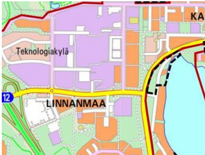
Kuva 4. Huvilarannantien asemakaava-alue (musta katkoviiva).

Asemakaava-alue sijoittuu Pyykösjärven luoteiskulmaan, järven ja Alakyläntien väliselle kaistaleelle ja kohde on pääosin rakennettua. Kohteen metsät ovat käsiteltyjä ja pääasiassa melko nuoria. Tämän vuoksi alueen lintulajisto on myös varsin tavanomaista (taulukko 5). Todennäköisesti vain osa lajeista pesii alueella, (todennäköisimmin ainoastaan peippo, pajulintu, leppälintu, talitiainen). Kohteen arvoa linnuston pesimäalueena köyhdyttää todennäköisesti tien ja jalankulkuväylän häiriö ja liikenteen melu.