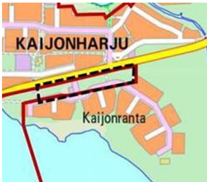
Kuva 5. Alakyläntie-Kauppaporvarintien asemakaava-alue (musta katkoviiva).

Alue on kauttaaltaan ihmisvaikutuksen piirissä ja alueella kulkee polkuja. Maasto ei ole alueen muusta ympäristöstä poikkeavaa, joskin alue itäpäässä on kosteampaa ja tavaltaan tarjoaa hieman tavanomaisesta tuoreesta kaupunkialueen kangasmetsästä poikkeavampaa pesimäympäristöä. Asemakaava-alueen pesimälajisto koostuu kuitenkin kaupunkimetsien yleisistä ja runsaista lintulajeista (taulukko 6). Vieressä kulkeva Alakyläntie on häiriön ja melun kautta heikentänyt kohdetta lintujen pesimäympäristönä.