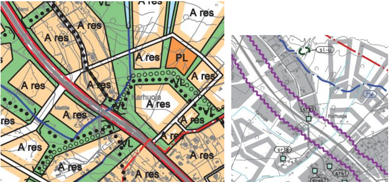
Kuva 3 Vasemmalla ote yleiskaavakartasta 1 ja oikealla ote yleiskaavakartasta 2.

Kohde on suojeltu voimassa olevalla asemakaavalla. Asemakaavan muutos ei koske kiinteistöä 564-140-548-1 .