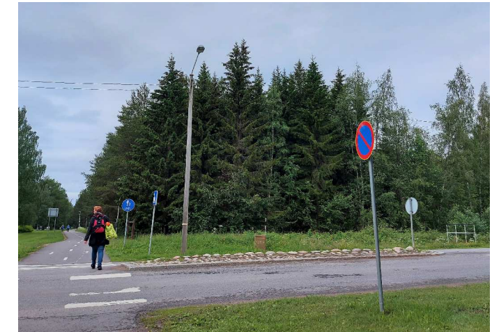
Kuva 3 Alueen vanhimmat Holstinmetsän kuuset rajaavat katunäkymää.