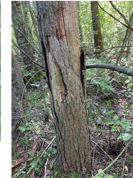
Kuva 14 Pystyyn kuollut mänty