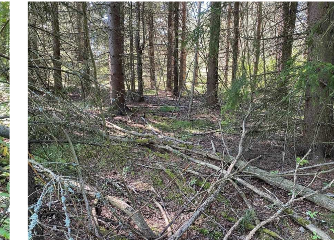
Kuva 15 Kuusilehto.