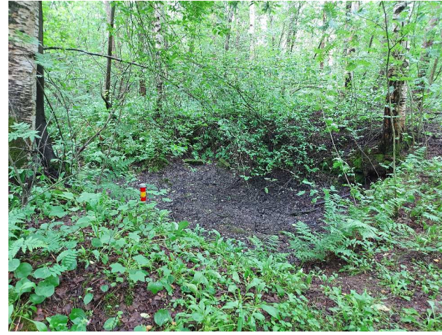
Kuva 8 Selvitysalueella sijaitsevan maakuopan alkuperä ei selvinnyt tämän selvityksen puitteissa.