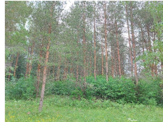
Kuva 2 Selvitysalueen eteläosassa oleva Rauhanmetsä on 1980-luvulla kaupungin toimesta istutettu mäntymetsä.