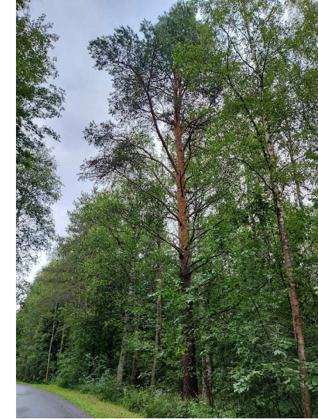
Kuva 10 Suuri mänty jalankulun- ja pyöräilyn reitin varressa.