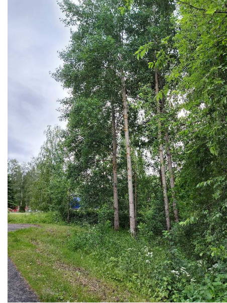
Kuva 9 Suurten haapojen ryhmä selvitysalueen pohjoisosassa.