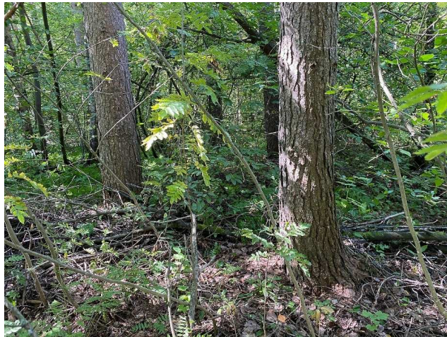
Kuva 12 Mäntyjä lehdossa.