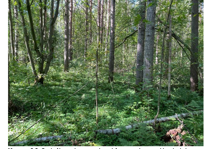
Kuva 11 Selvitysalueen keskiosan tuoretta lehtoa, jossa kasvaa istutettua mäntyä.