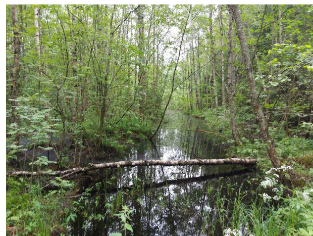
Kuvat 4 ja 5 Tulviva Holstinpuiston oja kesäkuussa ja kuivunut oja elokuussa 2021.