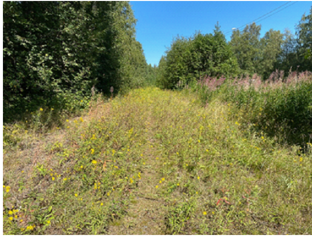
Kuva 7 Vuonna 2010 purettu Vihreäsaaren ratayhteyden maastokäytävä näkyy edelleen maastossa. Kasvillisuustyypiltään se on tuoretta niittyä, jossa lenteli kesällä 2021 useita neitoperhosia.