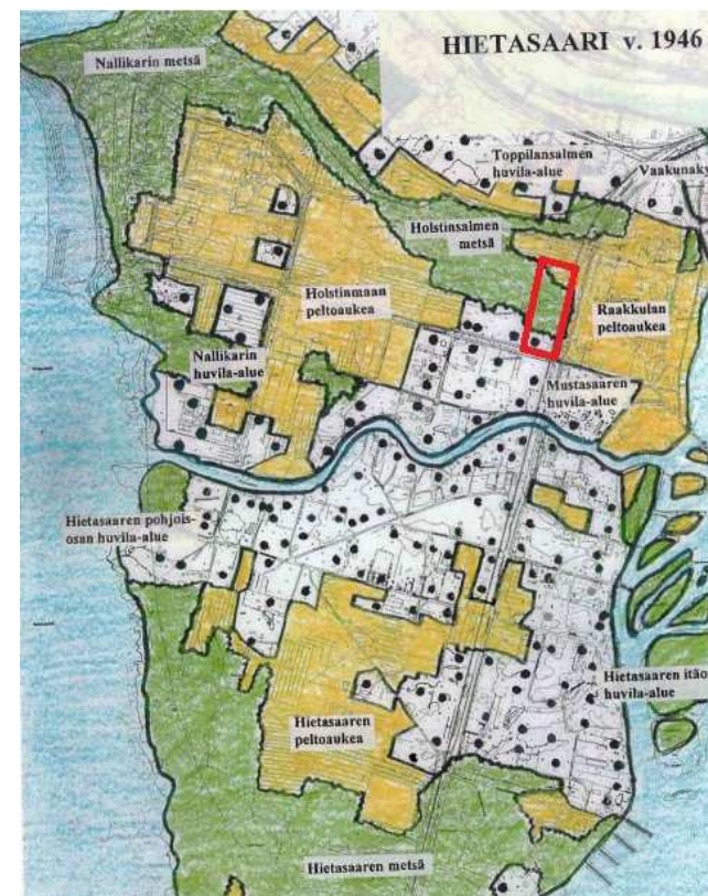
Kuva 6 Hietasaaren maiseman maankäyttöä vuodelta 1946. (Oulun kaupunki / Suunnittelu-keskus, Hietasaaren käyttö- ja maisemanhoitosuunnitelma 2000). Selvitysalue rajattu punaisella.