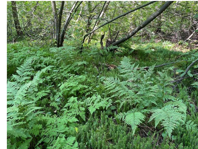
Kuva 13 Metsäalvejuurta ja riidenliekoa.