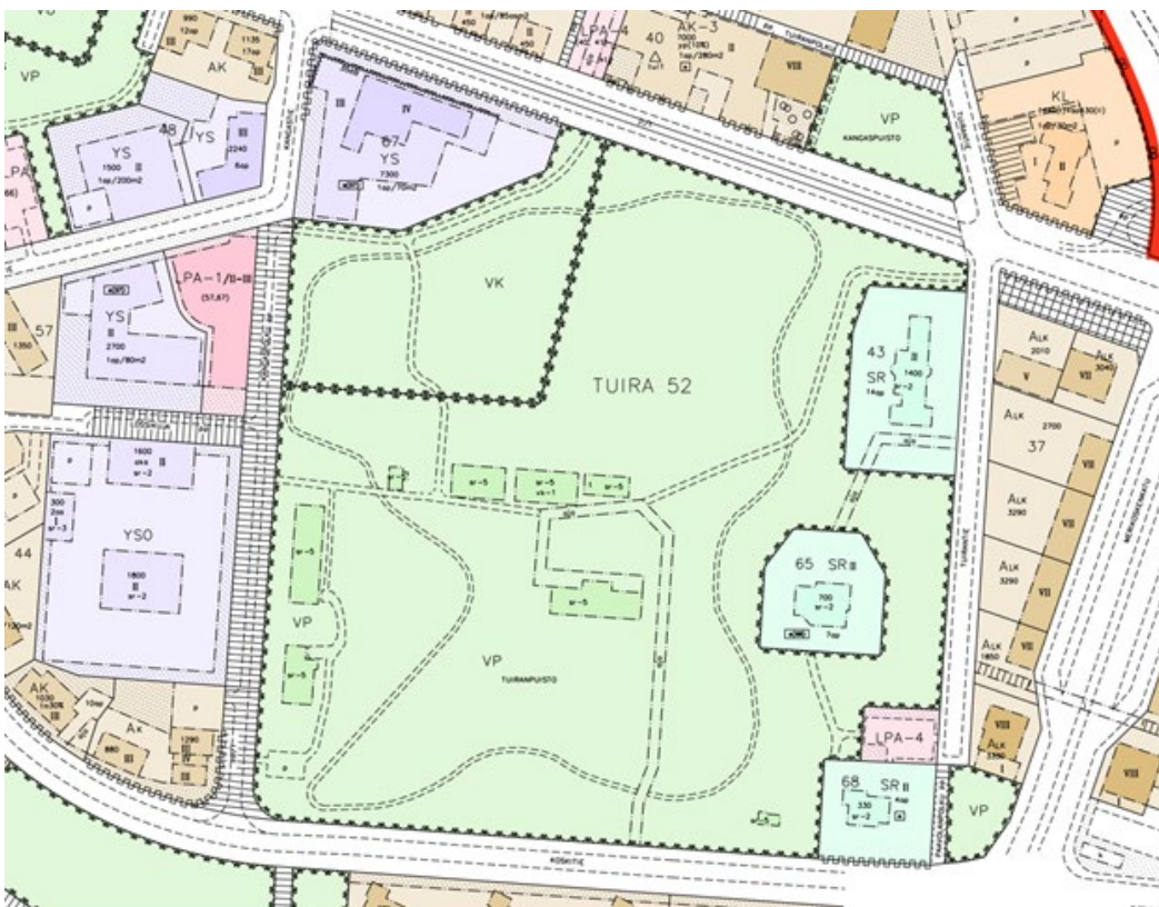
Kuva 3. Ote voimassa olevasta asemakaavasta

Koskitieltä on osoitettu ajoyhteys keskelle puistoa. Myös korttelien 43 ja 65 välille on merkitty ajoyhteys. Korttelin 68 pohjoispuolella on autopaikkojen korttelialue, jonka kautta saadaan järjestää ajoyhteys siihen rajoittuville korttelialueille.