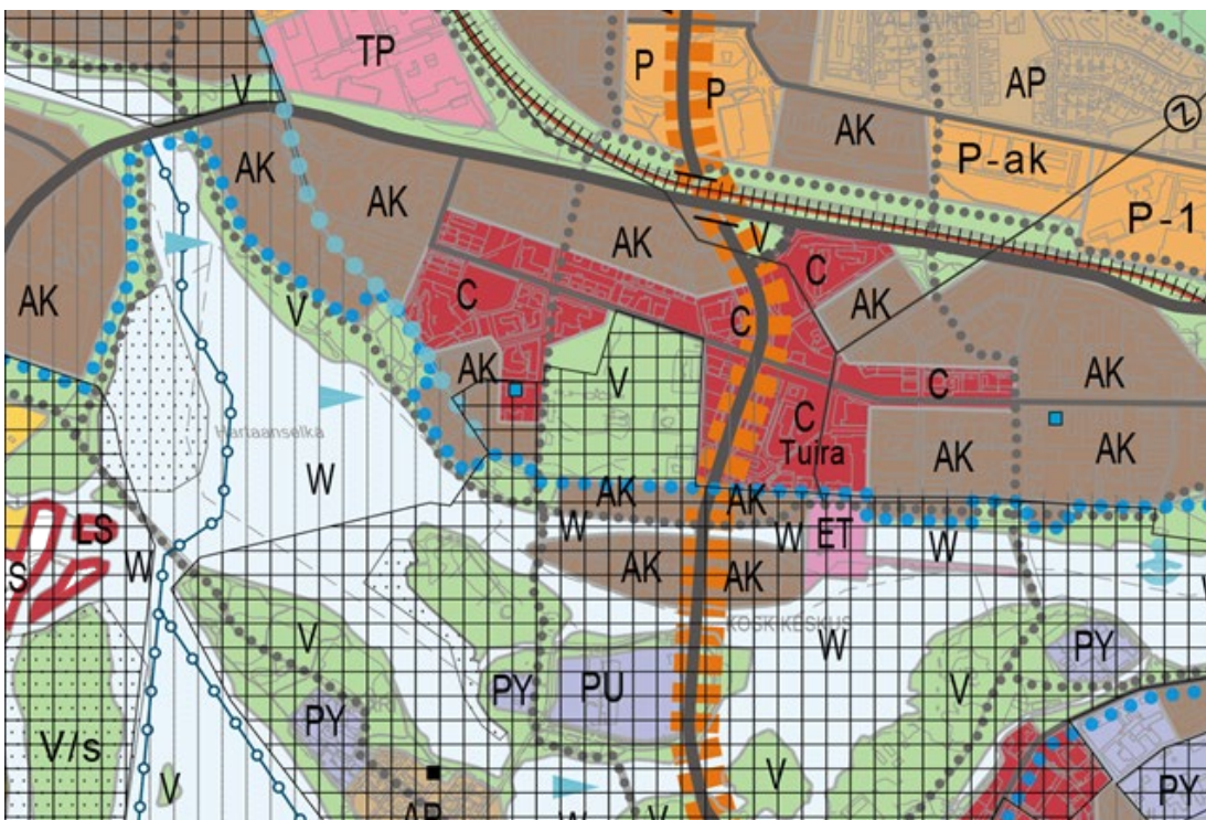
Kuva 2. Ote Uuden Oulun yleiskaavasta

Suunnittelualueen länsipuolella kulkeva Kangaspolku on kevyen liikenteen pääreitti. Suunnittelualueen lähetyvillä kulkeva Merikoskenkatu on merkitty kaupunkiraitiotien kehittämiskäytäväksi, jonka varrella maankäyttöä tulee tiivistää ja monipuolistaa niin, että tuetaan kaupunkiraitiotien toteuttamismahdollisuuksia. Kaupunkiraitiotien linjaus on ohjeellinen ja se tarkentuu jatkosuunnittelussa. Suunnittelualueen eteläreunalla kulkee Oulujoen suiston kaupunkipuisto -merkintä, jolla on osoitettu suistoalue, jolla on erityisiä maisema-, historia-, kaupunkikuva-, luonto- ja virkistysarvoja. Aluetta tulee kehittää niin, että sen erityisarvot säilyvät.