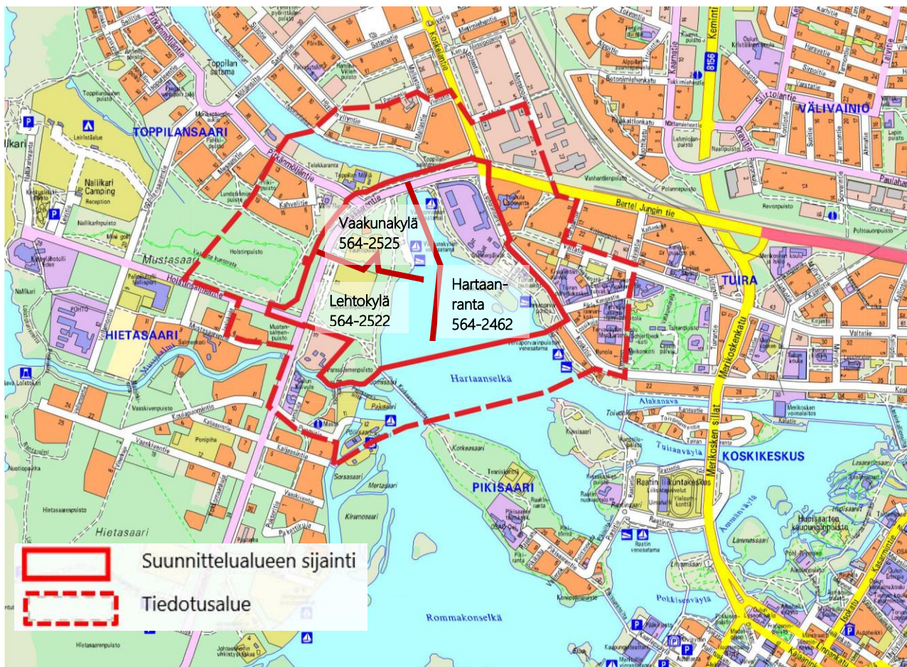
kuva 1 Suunnittelualue on rajattuna punaisella viivalla ja tiedotusalue on rajattu punaisella katkoviivalla.

Alueenne läheisyydessä on aloitettu yleissuunnitelman ja asemakaavan muutoksen laatiminen. Yleissuunnitelmassa määritellään millaista ja miten korkeaa rakentamista alueelle tulee ja miten alueen auto-, kävely- sekä pyöräilyliikenne järjestetään. Suunnitelmassa varataan alueet puistoja ja muita viheralueita varten, määritellään rantojen käsittely sekä hulevesien johtamis- ja käsittelytavat. Asemakaavalla tarkennetaan yleissuunnitelmaa määrittelemällä tarkat käyttötarkoitukset, rakennusalat ja rakennusoikeudet sekä antamalla alueen käyttöön liittyviä määräyksiä. Alue on jaettu kolmeen asemakaavan muutokseen Hartaanranta 564-2462, Vaakunakylä 564-2525 ja Lehtokylä 564-2522. Asemakaavamuutoksien on tavoite valmistua vuonna 2021.