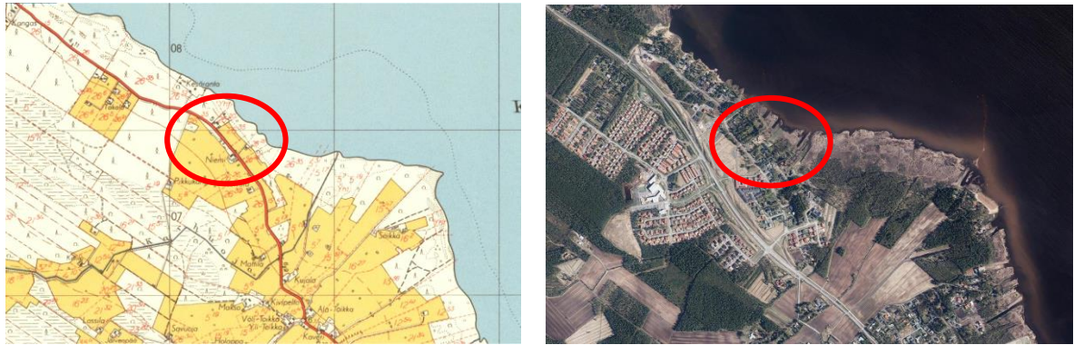
Kuva 2. Selvitysalueen sijainti vanhalla peruskartalla (MML, vanhat kartat v. 1953) sekä uudella ilmakuvalla (MML, 2020).

Niemenranta 28 tontilla on vanha peltopohja eikä sillä ole ollut luonnontilaista kasvillisuutta vuosikymmeniin. Kohde on vahvasti ihmistoiminnan muokkaama ja rajautuu rakennettuihin alueisiin sekä asfaltoituun tiehen ja pyörätiehen. Nykytilassaan kohde on rakennusalueen varikkona. Kohteella esiintyvä kasvillisuus on osin nurmieseoksesta peräisin ja osittain ns. pioneerikasvillisuutta, joka on tyyppillistä tienvarsille ja joutomaille. Tontti rajautuu lännessä entiseen kosteaan peltopohjaan, jolla on puun taimia. Hieman etäämmällä selvitysalueen ulkopuolella lännessä on tuoreen kankaan metsäpohjaa, jolla esiintyy noin 70-vuotias sekapuusto.