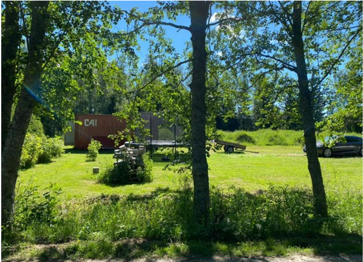
Kuva 9. Kiinteistölle johtavan kujan varrella on suuria harmaaleppiä