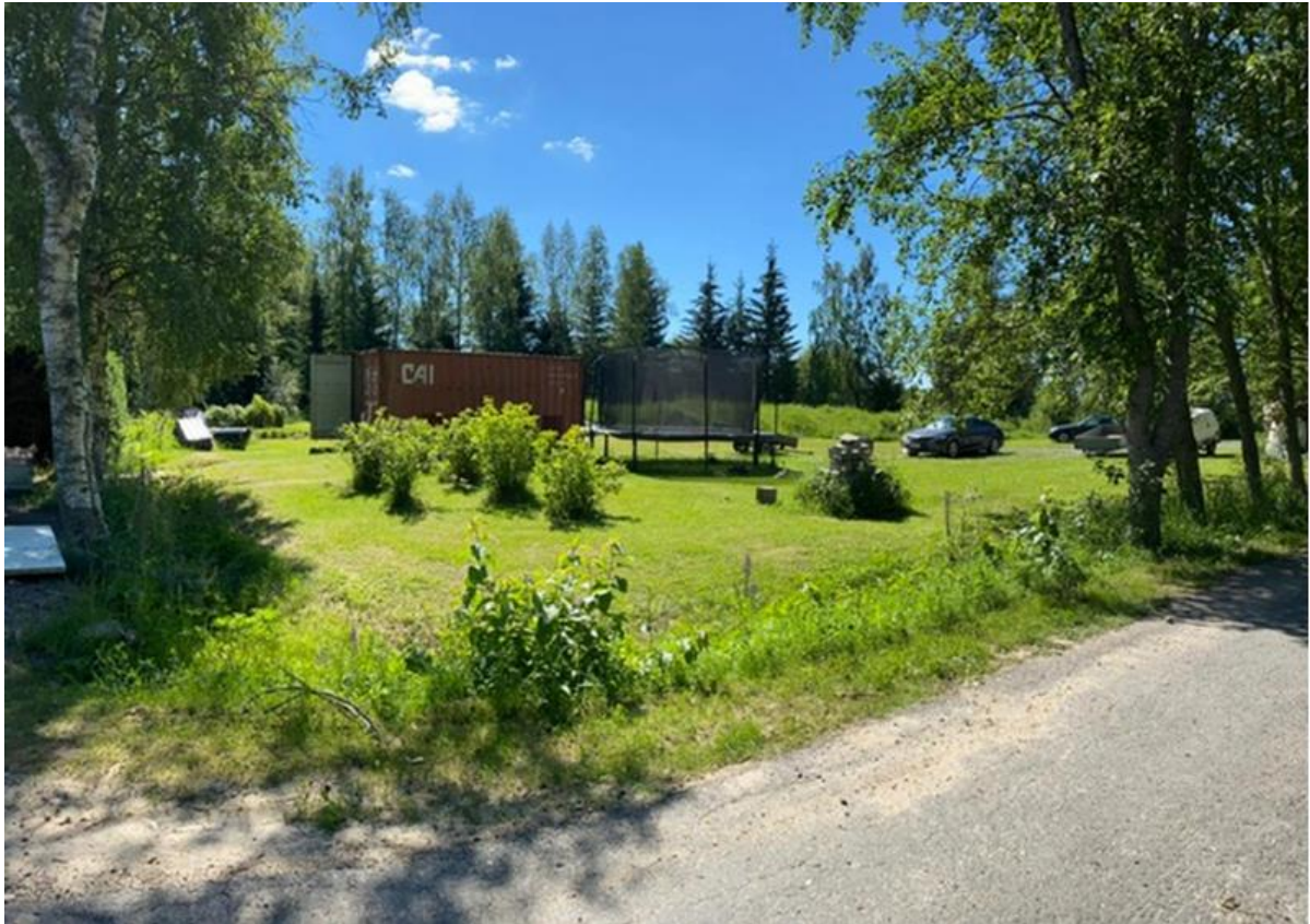
Kuva 4. Kiinteistö (564-430-26-141) kesällä 2021

Alue on entistä peltopohjaa, eikä sillä ole esiintynyt luontaista rantametsien sukkessiovaiheiden puustoa tai podsolimaannosta (ks. kuva 6. ilmakehu 1960-luvulta). Nykyisin kiinteistöllä on suuria lehtipuita, mutta ei juuri havupuita. Kiinteistölle johtavan kujan varrella on järeitä harmaaleppiä, jotka ovat tyypillisiä rantametsille. Alueen järeämpi puusto ei ole vuosikymmenten kuluessa juuri muuttunut, vaan vanha peltopohja on metsittynyt koivuvaltaiseksi puoliavoimeksi alueeksi, jonka puustoa on raivattu rakentamisen myötä.