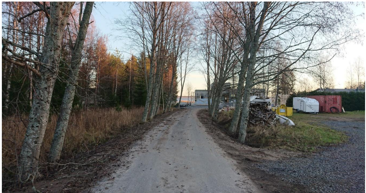
Kuva 7. Niementie 28:n kuja pihaan. Selvitysalue oikealla.

Tonttia vastapäätä Niementien länsipuolella on rakentamaton joutomaa-alue, jolla on ketomaisia perinnebiotoopin piirteitä; vanha pihlaja sekä kataja. Niementie 28:n tontin selvitysalueelta ei avaudu merkittäviä näkymiä laajalle ympäristöön.