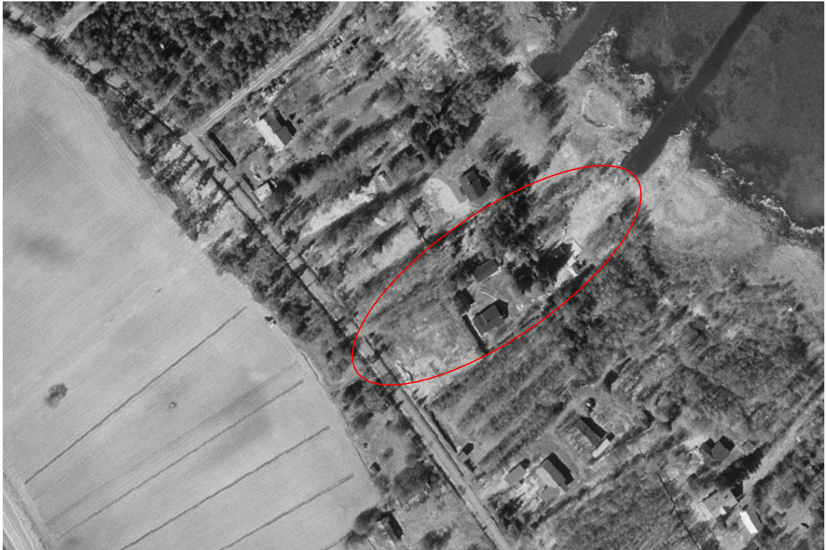
Kuva 6. Ilmakuva alueesta vuodelta 2020 (yläkuva) ja vuodelta 1960 (alakuva).