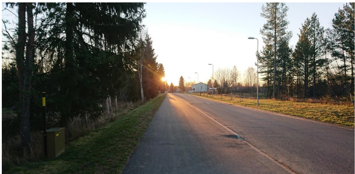
Kuva 8. Niementie 28:n kohdalta näkymiä kaakkoon.