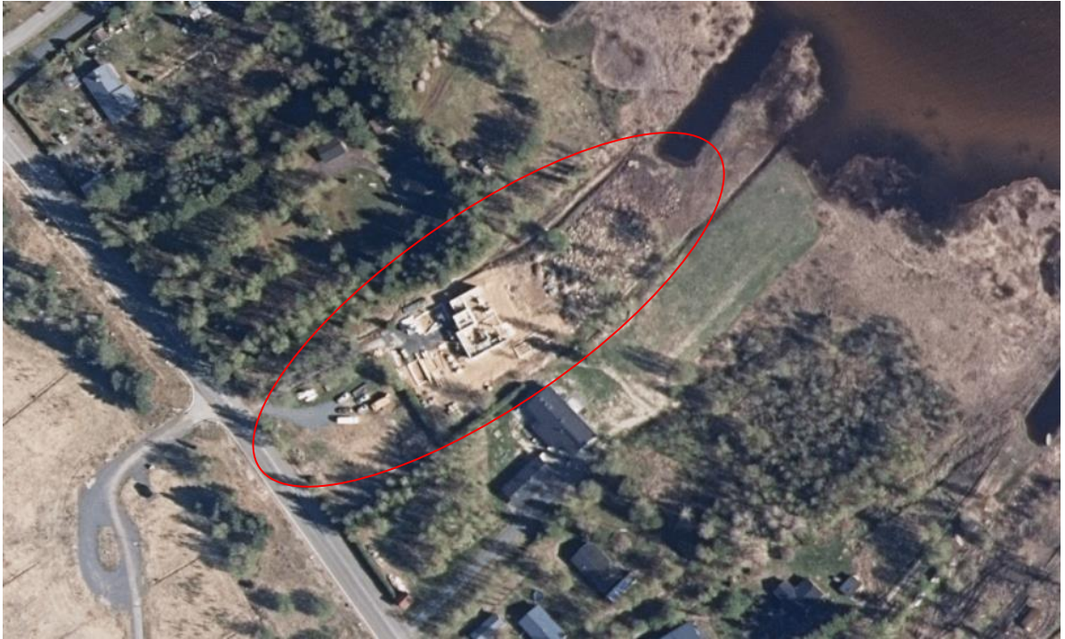
Kuva 5. Ilmakuva alueesta vuodelta 2020 (yläkuva) ja vuodelta 2014 (alakuva). (MML 7/2021)

Selvitysalueen tarkastelu vanhojen ilmakuvien perusteella. Tuoreimmista ilmakuvista osa on otettu keväällä ja osa kesäaikaan. Ilmakuvia on tarkasteltu MML:n historiallisten kartta-aineistojen avulla.