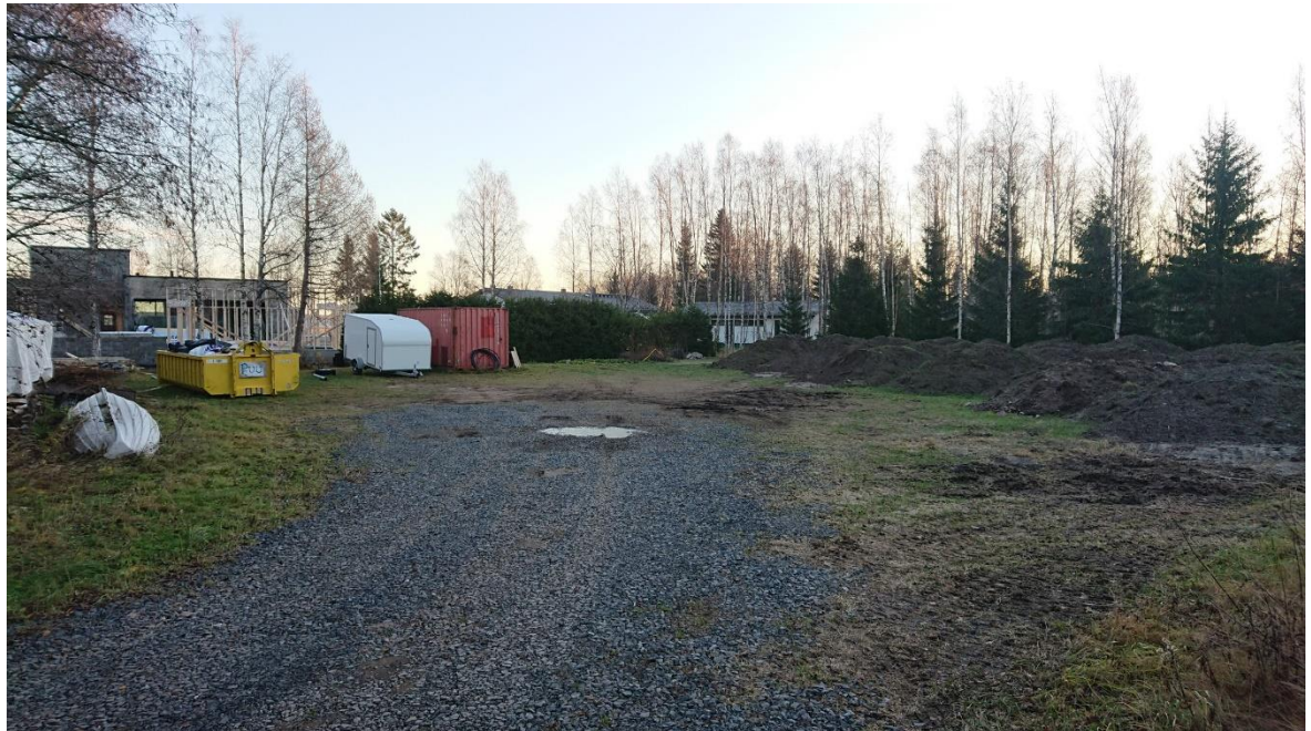
Kuva 3. Selvitysalue Niementie 28:n kiinteistö (564-430-26-141) syksyllä 2020