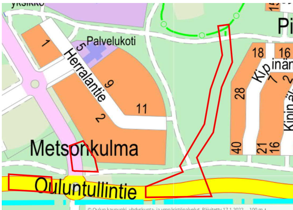
Kuva 1. Suunnittelualueet opaskartalla

Suunnittelualue rajoittuu etelässä Kempeleen kunnanajaan. Ouluntullintiellä suunnittelualue sijoittuu 150 - 650 m moottoritien (Vt4) itäpuolelle sijoittuvalle alueelle. Metsokankaantiellä suunnittelualue sijoittuu Ouluntullinpolun akselin pohjoispuolelle, noin 100 metrin matkalle. Pohjoisessa suunnittelualue ulottuu Kotimetsän puistoalueella sijaitsevan Hartsuherranpolun pohjoispuolelle. Kuvassa 1 on esitetty suunnittelualueiden rajaukset.