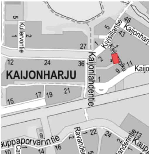
Kuva 1. Suunnittelualue opaskartalla

Suunnittelualue rajoittuu kadun pohjoispuolella nykyiseen Kaijonpolkuun, itäpuolella kiinteistörajaan ja puistoalueeseen, länsipuolella kiinteistörajaan ja eteläpuolella Kaijonpuistoon. Katualueen leveys on 6 m.