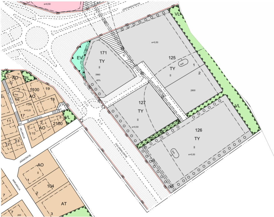
Kuva 2. Ote ajantasa-asemakaavasta