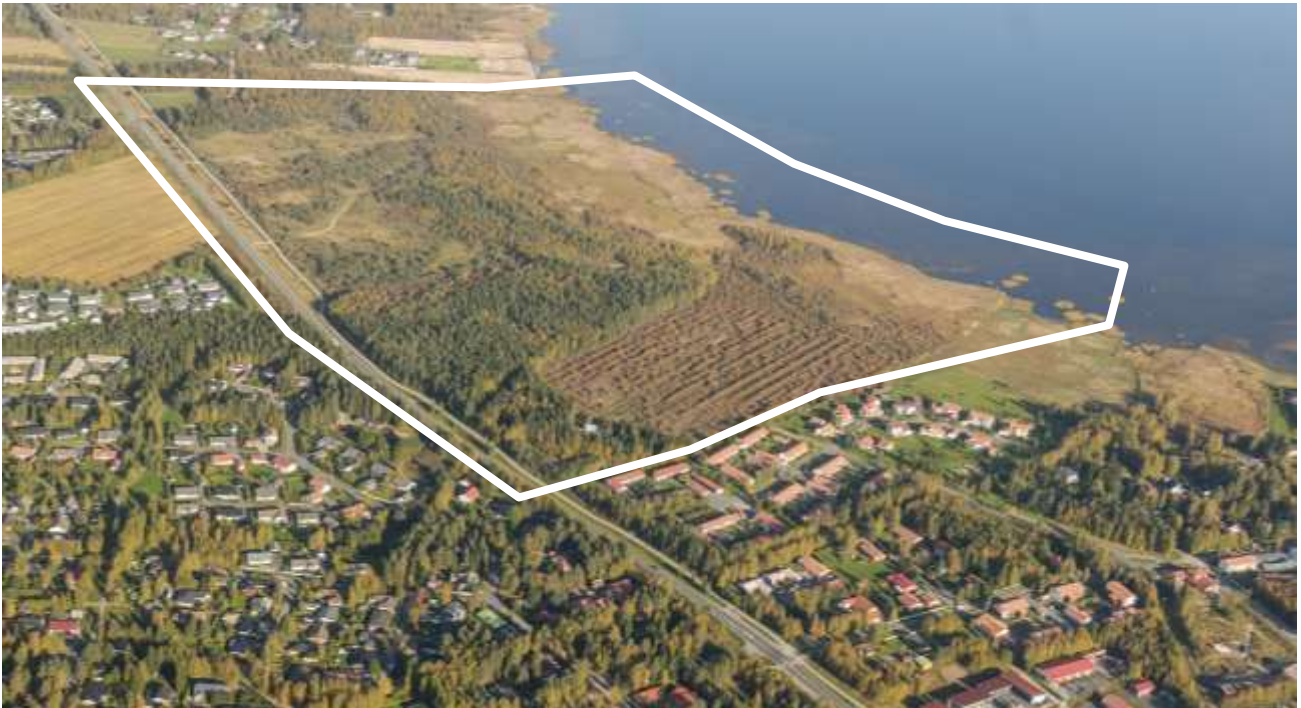
Ilmakuva suunnittelualueesta, © Lentokuva Vallas Oy, Oulun kaupunki, 2014

Kaavatunnus 564-2239 Diaarinumero 572/2014 Projektinumero 712 500