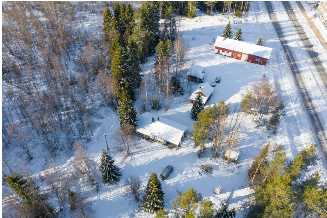
Kuva 1. Ritaharjun selvitysalueella jäljellä olevat rakennukset ilmakuvassa 28.2.2020.