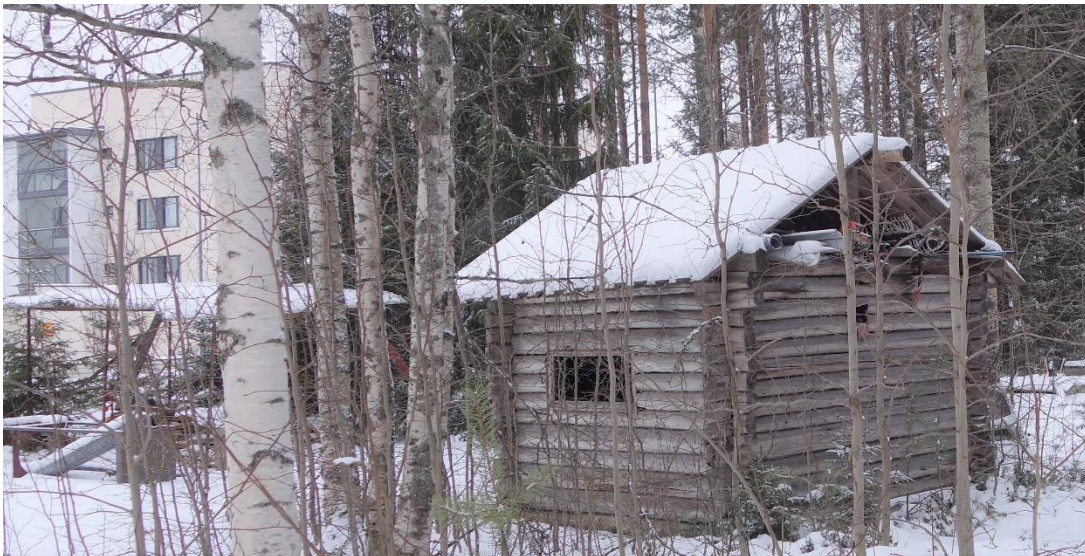
Kuva 4. Pieni avonainen aittarakennus ei sovellu lepakoiden talvehtimispaikaksi.