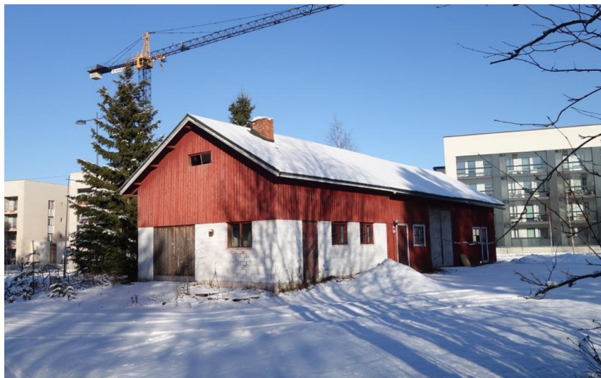
Kuva 2. Tarkistettu latorakennus kuvattu ulkoa 28.2.2020.

Alakerran katon ja kipsilevyjen välinen tila olisi voinut olla sopivampi talvehtimispaikka lepakoille, mutta sieltäkään ei havaittu eläimiä tai merkkejä niiden esiintymisestä. Tulosten perusteella ladon ei arvioida myöskään olevan todennäköinen lisääntymispaikka lepakoille, koska sieltä ei löydetty jätöksiä. Tämän selvityksen perusteella ei voida sulkea mahdollisuutta pois, että lato toimisi kesäisin satunnaisena päiväpiilopaikkana lepakoille.