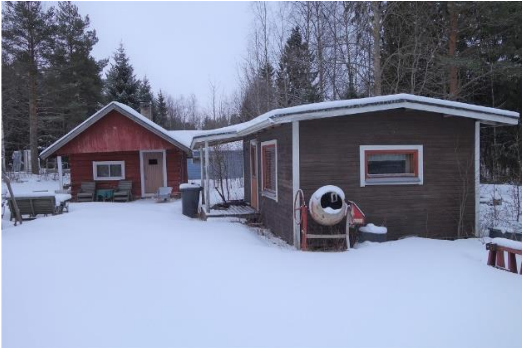
Kuva 3. Saunan viereisessä varastotilassa ei havaittu lepakoita. Paikka on liian vetoinen ollakseen soveltuva lepakoiden talvehtimispaikaksi. Lisäksi rakennuksessa on todennäköisesti ollut sen verran ihmis-toimintaa, että paikka ei ole rauhallinen.