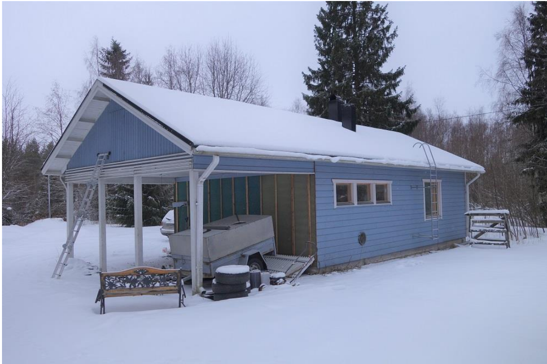
Kuva 5. Sinistä taloa ei käyty tarkistamassa sisältäpäin. Rakennuksessa näyttänyt olevan sellaisia aukkoja, joiden kautta lepakoita voisi päästä sisälle. Lisäksi rakennus on käytössä/tyhjennetään.