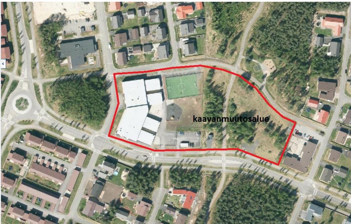
Kuva 2: Kaavamuutosalue rajattuna ilmakuvaan

Asemakaavan tavoitteena on kaavoittaa tontti uudelle perusopetuksen alaluokkien koululle. Koulun suunnittelu on aloitettu laatimalla hankeselvitys sekä siihen liittyvät koulurakennuksen ja pihan viitesuunnitelmat. Hankeselvitistyössä arvioitiin Ritaharjun oppilasennustetta ja sen ikäjakauman kehitystä sekä tulevien vuosien oppilasmäärien sijoittumista alueella. Viitesuunnitelmissa esitettiin mm. uuden koulun sijoittumien ja koko, alustava tilaohjelma sekä mahdolliset pihajärjestelyt. Nykyistä pallokenttää esitetään suurennettavaksi. Uusi koulu toteutetaan vuokrausmenettelyä ja sille kaavoitetaan oma tontti.