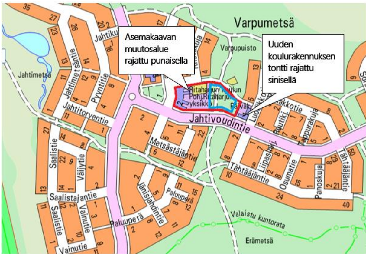
Kuva 1: Kartalle on rajattuna alue, jolle asemakaavan muuttamista suunnitellaan

Ritaharjun kaupunginosassa Jahtivoudintien pohjoispuolisella Varpupuiston alueella on tullut vireille asemakaavan muutos. Asemakaavan tavoitteena on kaavoittaa tontti uudelle alaluokkien koulurakennukselle nykyisten Pohjois-Ritaharjun koulun ja päiväkodin väliin. Asemakaavan on tarkoitus valmistua vuoden 2021 aikana.