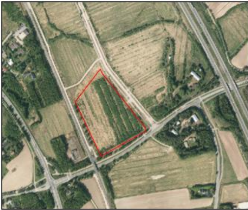
Kuva 1. Ote ilmakuvasta, jossa suunnittelualue rajattuna.

Suunnittelualue sijaitsee Perävainion kaupunginosassa Oulunportin osa-alueen eteläosassa. Suunnittelualueeseen kuuluu korttelin 54 tontti nro 1. Suunnittelualue rajautuu lännessä rautatiehen, idässä Visiolinja-katuun, pohjoisessa Visiopuistoon ja sen läpi kulkevan 110 kV:n voimalinjan vaara-alueeseen, ja etelässä Huhtakalliontiehen. Suunnittelualue on rakentamaton entinen pelto, joka osittain kasvaa pensaikkoa. Suunnittelualueen pinta-ala on 3,5 ha. Alue on Oulun kaupungin omistuksessa.